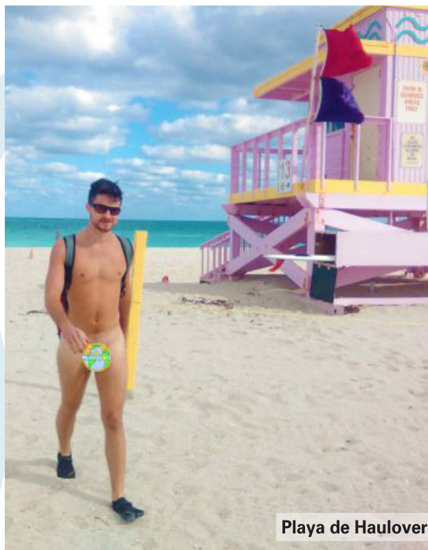
Playa de Haulover