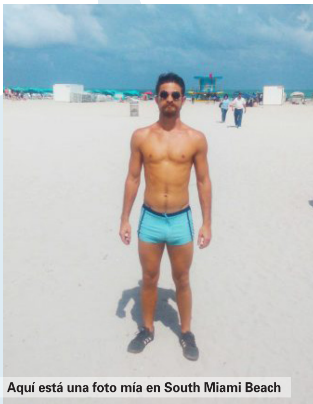
Aquí está una foto mía en South Miami Beach

Haulover Beach está en el extremo norte de Miami Beach y es una playa nudista legalmente reconocida que te permitirá obtener la cantidad máxima de vitamina D biológicamente posible (¡que es mucha!).